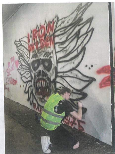
Tunel zyskał kolorowe logo zespołu muzycznego