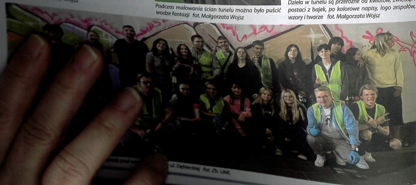
ul. Dębieckiej