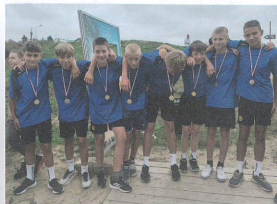
Drużyna biegaczy sztafetowych