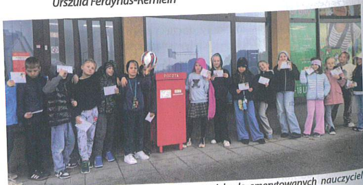
Uczniowie wysłali kartki z okazji Dnia Nauczyciela do emerytowanych nauczycieli „Cieszkowianki”