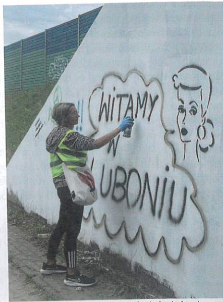
Kolorowe napisy – dzieła mieszkańców Lubonia