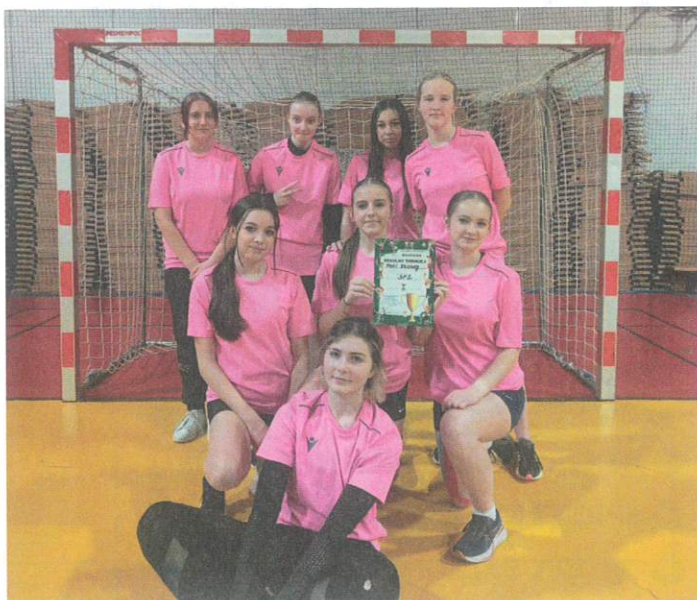
Nasze uczennice zwyciężyły w Mistrzostwach Lubonia w piłce ręcznej dziewcząt