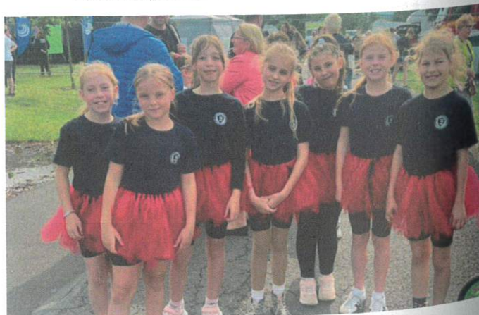
Uczniowie „Cieszkowianki” – mali artyści na Dniach Lubonia