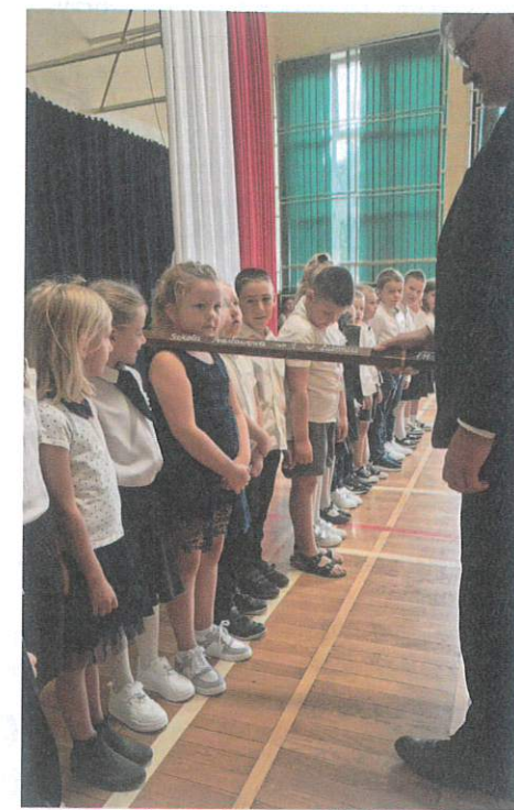
Dyrektor szkoły uroczystie pasował każde dziecko