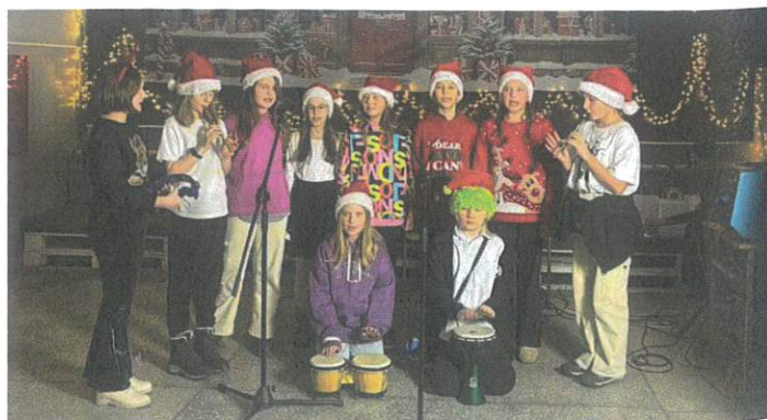
Uczniowie SP2 podczas Miejskiego Konkursu Kolęd, Pastoralek i Piosenek Świątecznych