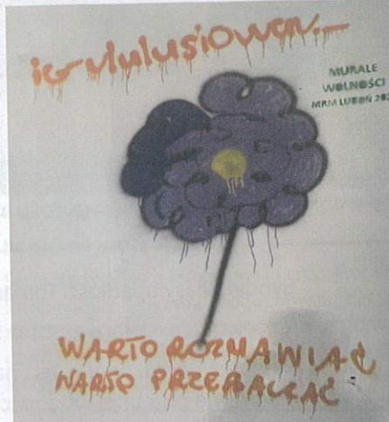
Dzieła w tunelu są przeróżne od kwiatów, zwierząt i postaci z bajek, po kolorowe napisy, logo zespołów, wzory i twarze