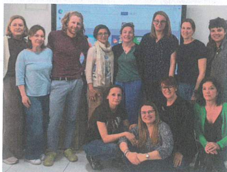
Anglistki z SP2 na kursie metodycznym organizowanym przez ETI – Executive Training Institute na Malcie