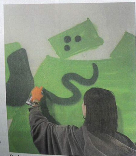
Podczas malowania ścian tunelu można było puścić wodze fantazji