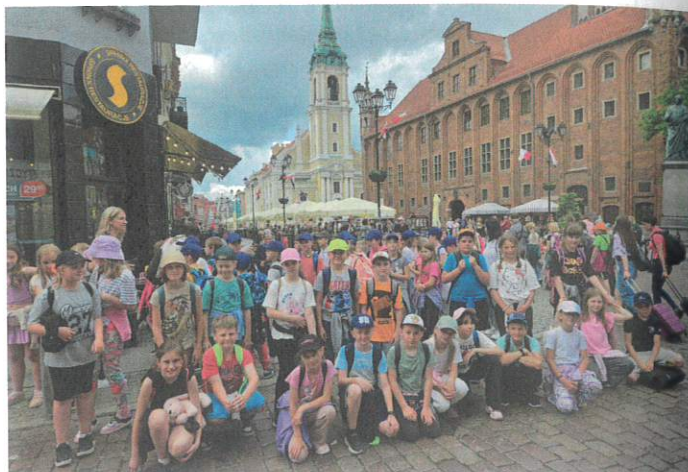
Uczniowie klas trzecich w Toruniu