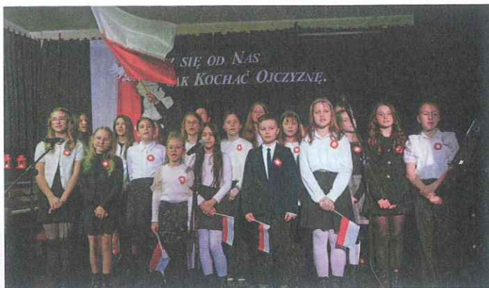
Tradycyjna już „Wieczornica” organizowana przez SP1 w Luboniu odbyła się pod tytułem „Ucz się od Nas jak Kochać Ojczyznę”