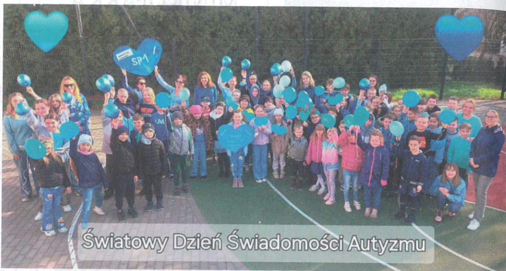
Światowy Dzień Świadomości Autyzmu

Światowy Dzień Świadomości Autyzmu w SP1