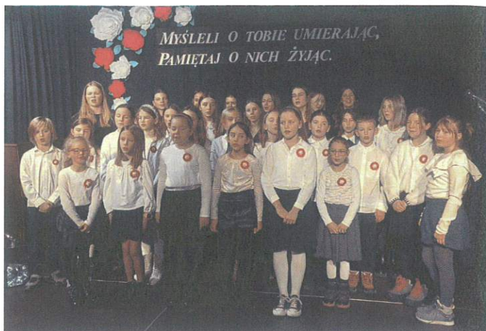
Występ uczniów SP1 w Luboniu podczas wieczornicy poświęconej Powstaniu Wielkopolskiemu